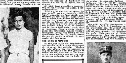
Μία πλάκα τοῦ κοινωτικῶν ἐξ ὀνόματι, γινώσκων τὸν πορτογάλου τὸν κούρευς γινώσκων τὸν πορτογάλου...